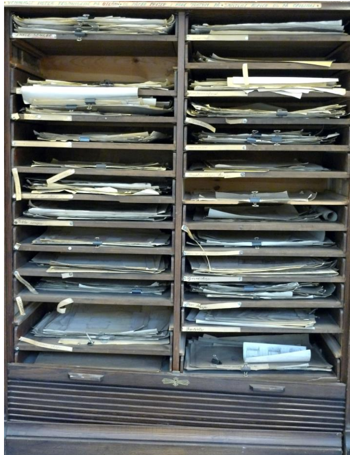
Ill. 2. Treskap som ble levert Bergen Byarkiv med kopier av møbeltegninger. Flere av kopiene var håndkolorerte.

Når arkivmateriale blir levert inn til Bergen Byarkiv kan det komme både i kasser, i plastposer, i koffertene og i sekker. Enkelte ganger kommer det også inn i ulike møbler. Noen av tegningene til Knag ble levert i et treskap med uttrekkbare hyller og sjalusidør. Skapet inneholdt kopier av møbeltegninger kategorisert etter type møbel. Ellers kom materialet hovedsakelig i kasser som inneholdt permer med korrespondanse og ulike fakturaer, og pakker – også med ulike fakturaer. Noen av pakkene inneholdt sågar flere mindre pakker. Mange var merket med type faktura og dato. Kassene inneholdt også ulike typer protokoller.