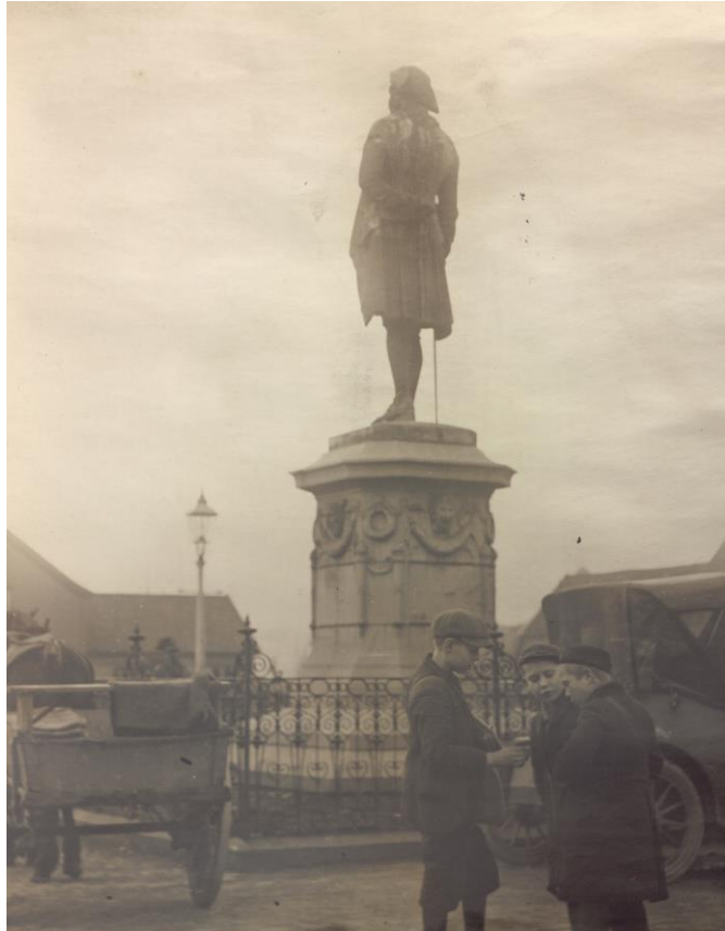
Ill. 6 Foto av Holbergstatuen og tre avisgutter. Ukjent fotograf og år.