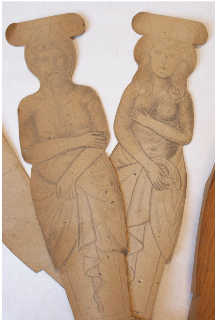
III. 3. Sjablonger. A-1790, Wh 1, Bergen Byarkiv.

I arkivet kan vi også finne ulike typer materiale som korresponderer med hverandre. Et eksempel er en kiste med et utskåret motiv som viser stadsporten i Bergen. Det finnes en tegning av kisten og en skisse av stadspormotivet, og blant prøvene på treutskjæringer finner vi samme motivet på et plankebord, og i fotosamlingen er det et foto av kisten. Et annet eksempel er et motiv av en dame og en mann på to sjablonger. Det samme motivet finner vi igjen på en skisse av en hjørnesofa med bokhylle og på en tegning av et skap. Dette sier litt om måten Knag jobbet på. For eksempel lagde de flere skisser for et møbel eller for en utskjæring ut ifra kundens ønsker. Kunden kunne så velge mellom de ulike skissene. Deretter ble det lagd en prøve på utskjæringen, som kunden godkjente før videre arbeid. Samme utskjæring og den ferdige tegningen ble brukt videre